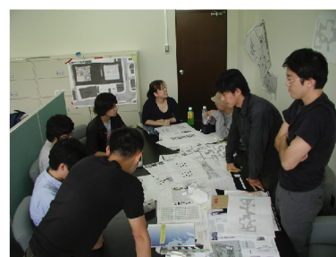
ミーティング風景