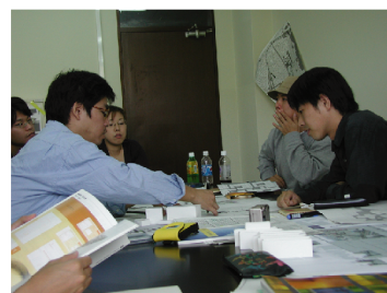
ミーティング風景

住空間デザインコンペでは、Web上のコミュニケーションツールを使用することなく、チーム内でのコミュニケーションは全てフェイスツーフェイスミーティングで行った。いわゆるオーソドックスなミーティング形態で、図面や模型、CG、スケッチなど様々なメディアを利用してデザインを進めていきました。